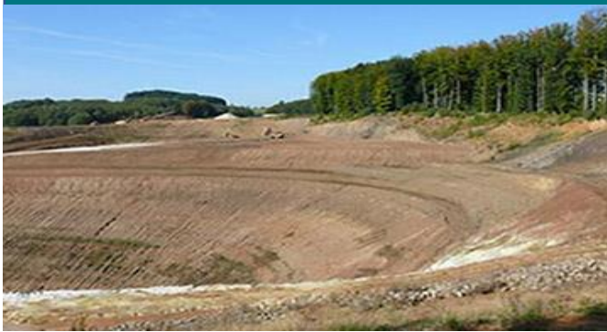
Rekultivierte Landoberfläche (mit Böden)