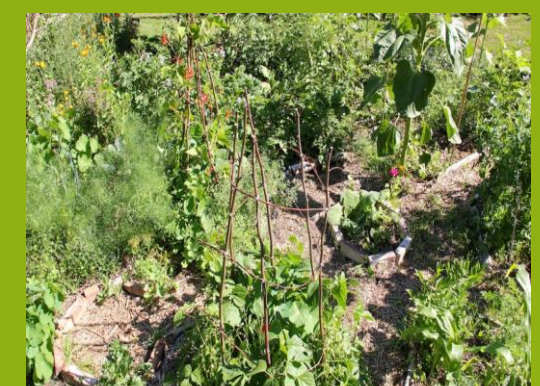
Permakultur (Anbaumethode, deren Ziel es ist, nutzbare Ökosysteme zu schaffen, die sich selbst erhalten können)